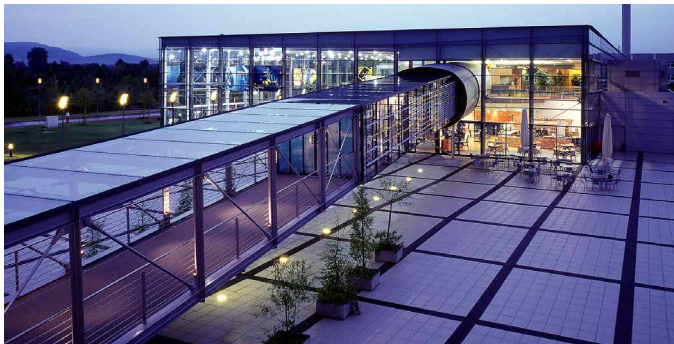
Daimler Kundenzentrum, Rastatt