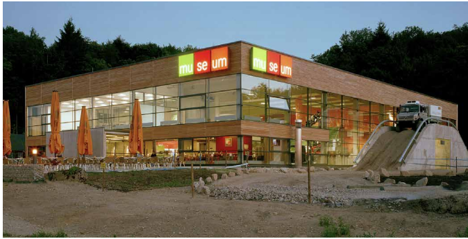
Unimog Museum, Gaggenau